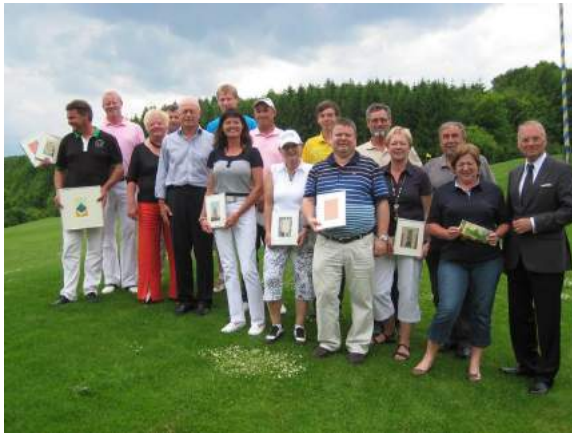
Sieger ART Cup (Maarten Thiel Gedächtnis Cup)