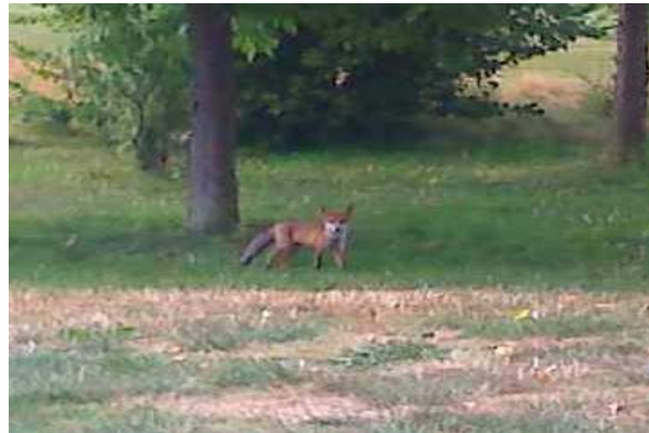
ein „Zuschauer“ am Abschlag 4 !