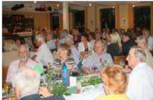
Wettspiel „Damen mit Herren“