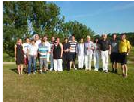
Sieger Toschi Cup