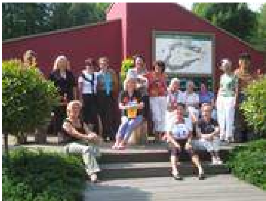
EDaGo Reise nach Stromberg