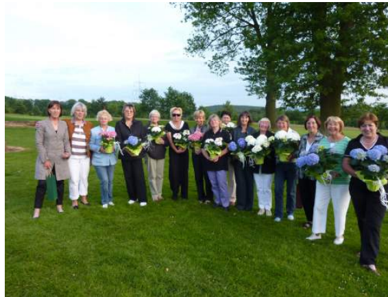
EDaGo in Wissmannshof