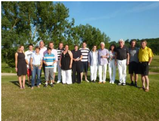
Sieger TOSCHI Cup