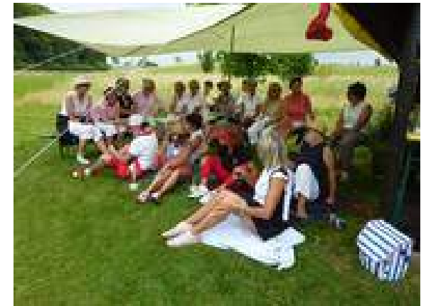
EDaGo Picknick Turnier