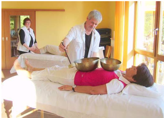
Kosmetik Turnier EDaGo