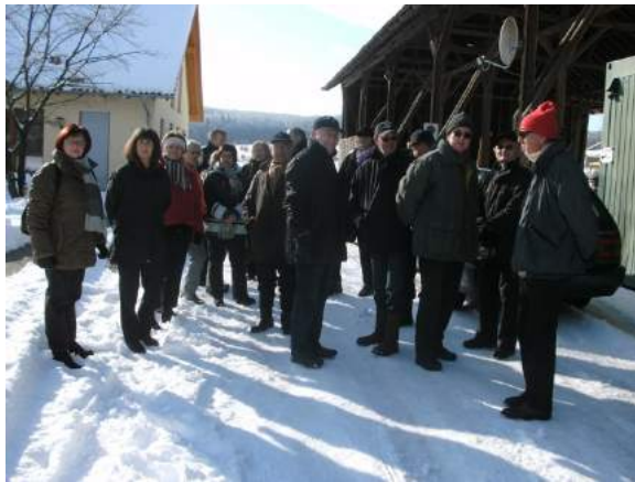
Winterwanderung Damen u. Herren