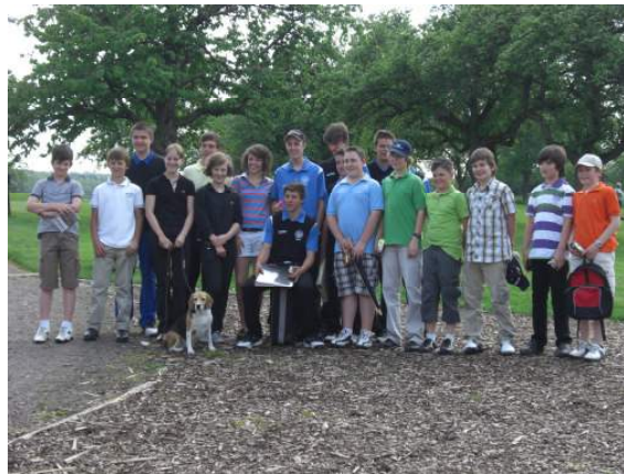
Jugend im GC Willershhausen