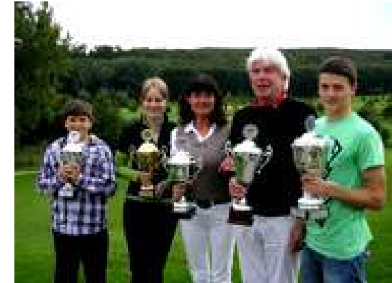
Schüler-, Jugend - und Senioren