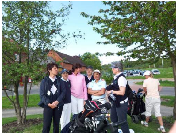
Jungseniorinnen in Braunfels