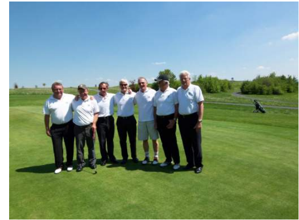
Senioren in Praforst