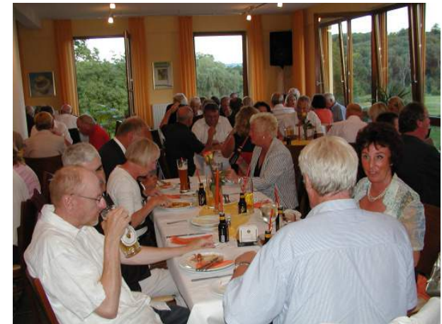
Damen mit Herren