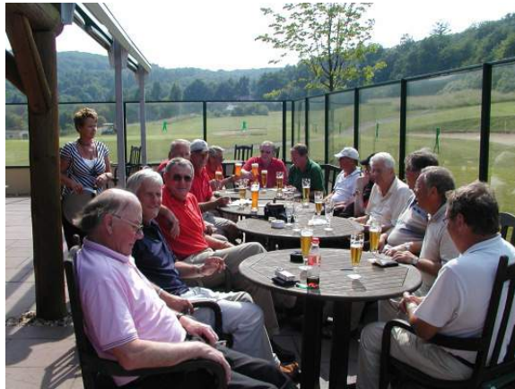
EHG Reise 03.-07.06.