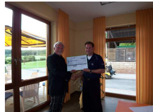
Scheckübergabe Charity Turnier „Kinder des Themba“