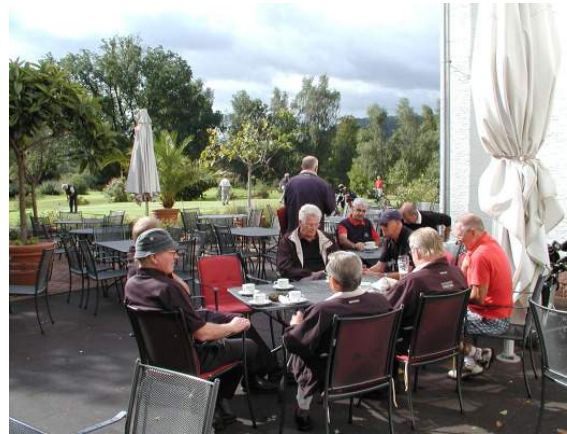
EHG Fahrt ins Blaue