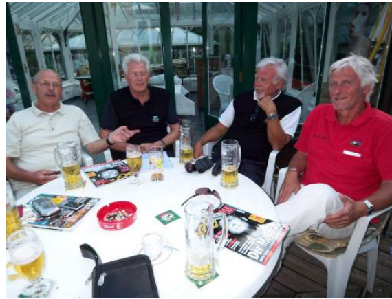
Senioren in Sickendorf