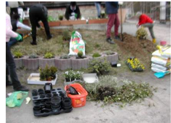
Verschönerung der Terrasse EDaGo