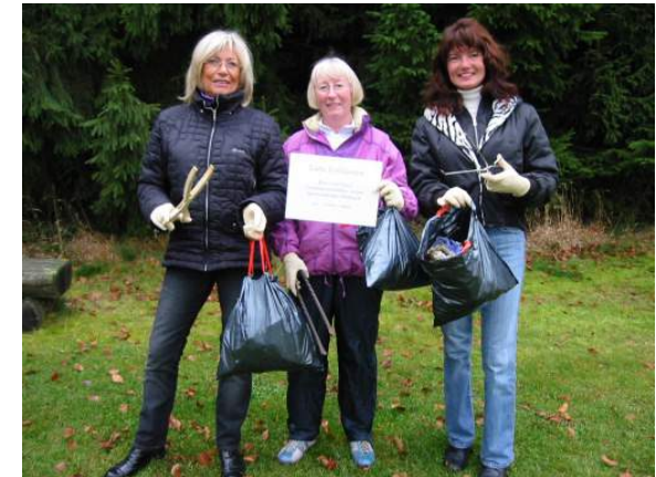
Säuberungsaktion wegen fehlender Toiletten