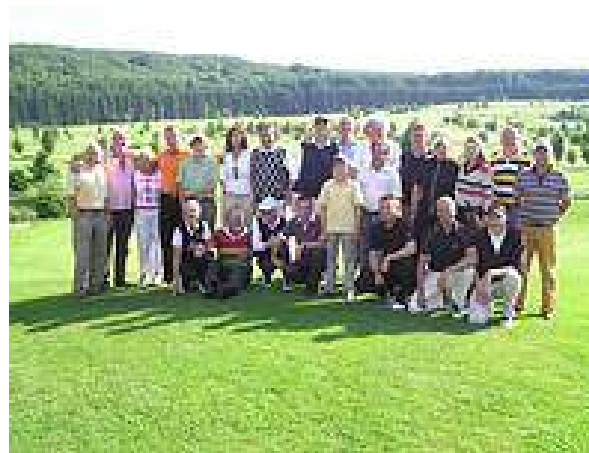
Turnier „Wandern Für Kinder“